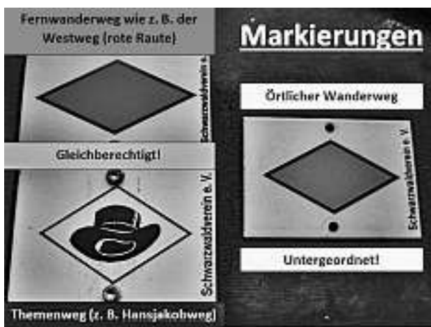
Montage von Albert Schrempp: Die bekanntesten Markierungen in Oberwolfach