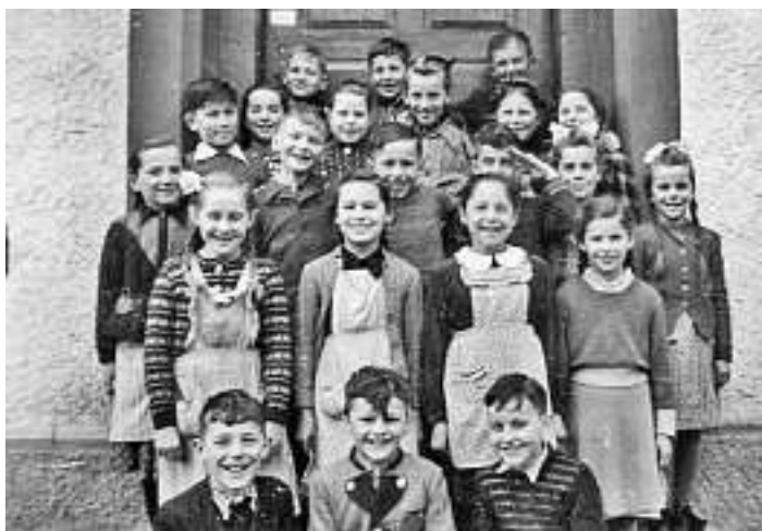
Bild Nr. 726: Sie wurden bereits oder werden im Laufe des Jahres 75 Jahre alt: Jahrgänge um 1943 und 1944 im Ortsteil Kirche!