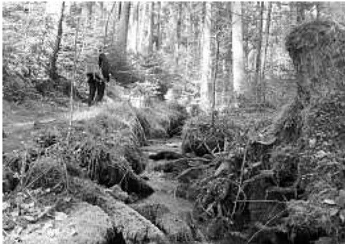
Auf dem erlebnisreichen Bad Teinacher Genießerpfad

Schnappenrad und zurück zum Wanderheim Zavelstein. Hier ist eine abschließende Einkehr geplant. Trotzdem sollte man ein Rucksackvesper mit Getränk mitnehmen! Die Tourendaten: 14 Kilometer, 380 Höhenmeter mit einer gesamten Wanderzeit von ca. 4,5 Stunden!