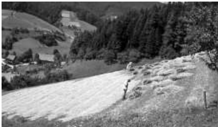
Foto – Nr. 774: Bis in die achtziger Jahre des vorigen Jahrhunderts konnte man vor allem an den Hängen der Seitentäler noch üppige Roggenfelder bewundern. Die goldgelben Flächen zwischen grünen Kartoffelfeldern und Wiesen sorgten für ein reizvolles und abwechslungsreiches Landschaftsbild, das man heute in den Schwarzwaldtälern so leider nicht mehr kennt. Hier ein Foto von einem Kornfeld des Heitzemehofes im Gelbach.