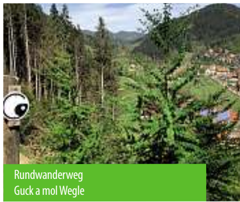
Rundwanderweg Guck a mol Wegle