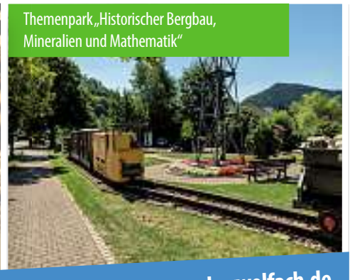
Themenpark „Historischer Bergbau, Mineralien und Mathematik“