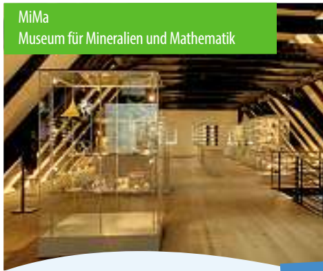
MiMa Museum für Mineralien und Mathematik