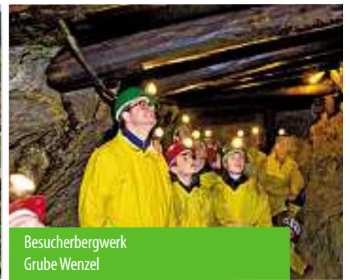
Besucherbergwerk Grube Wenzel