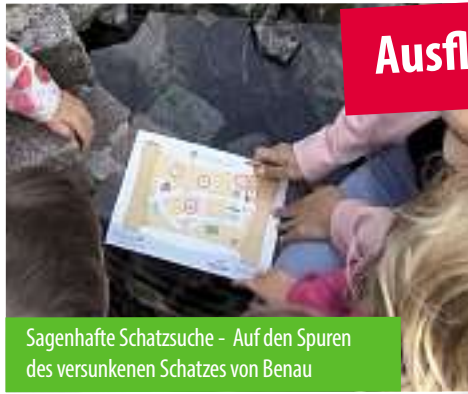
Sagenhafte Schatzsuche - Auf den Spuren des versunkenen Schatzes von Benau